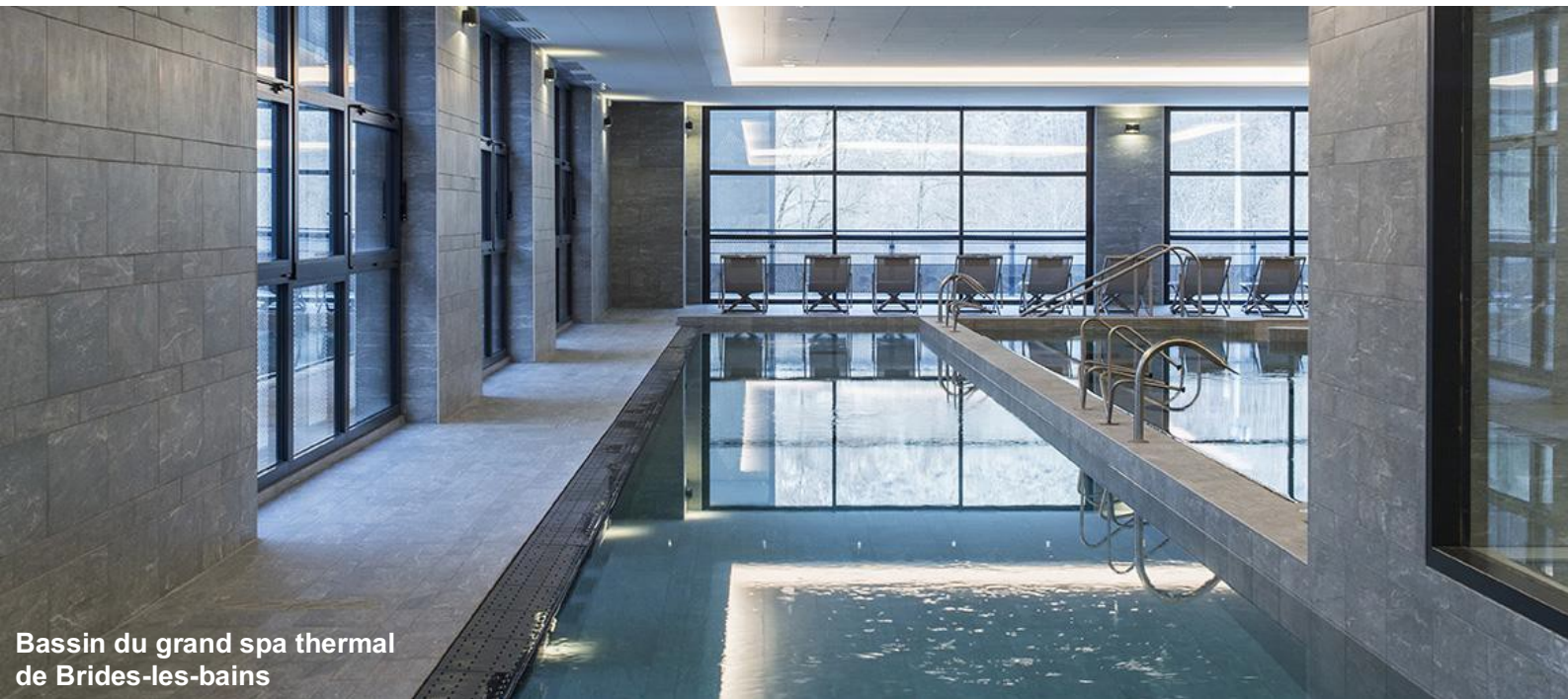
Bassin du grand spa thermal de Brides-les-bains